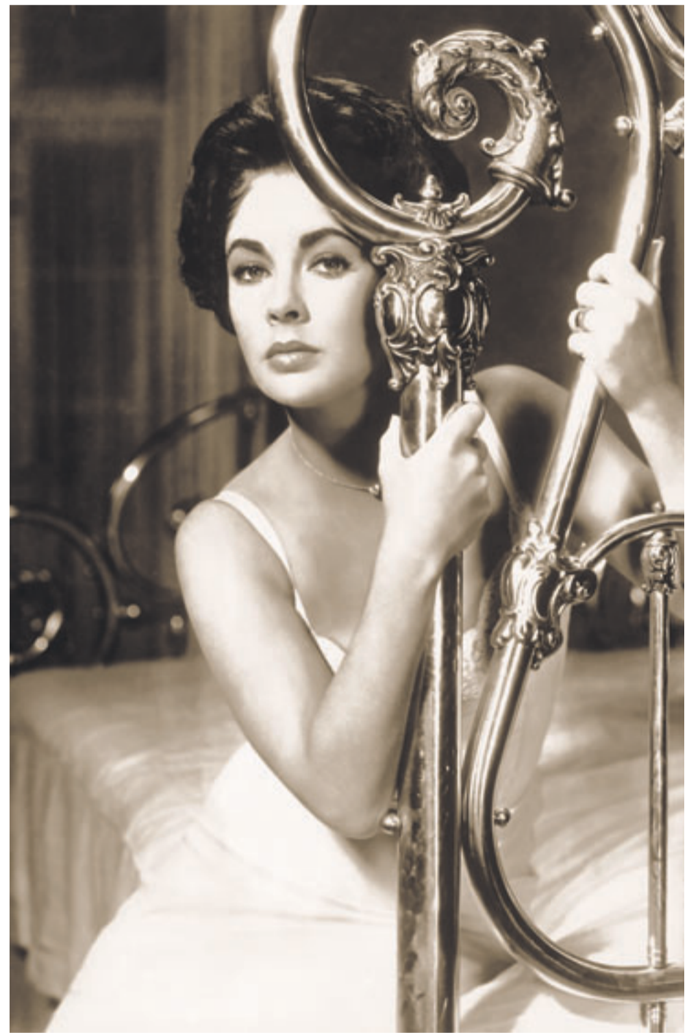
Elizabeth Taylor im Film „Die Katze auf dem heißen Blechdach“ – die mehrfache Oscar-Preisträgerin ist gestern in Los Angeles gestorben.

Los Angeles. Elizabeth Taylor ist tot. Die Hollywood-Legende starb am Mittwoch im Cedars-Sinai Hospital in Los Angeles im Kreis ihrer Familie. Taylor wurde 79 Jahre alt. Als Todesursache wurde Herzversagen angegeben. Taylor hatte seit Jahren gesundheitliche Probleme und musste in den letzten Monaten mehrfach im Kranken-