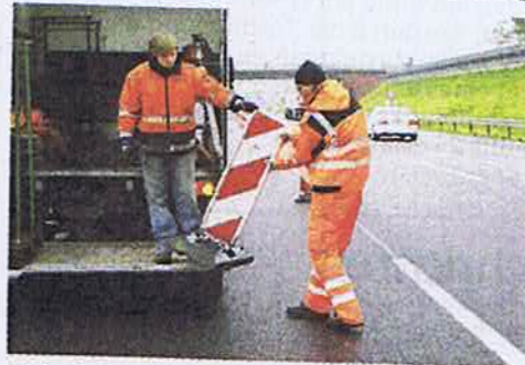
Freie Fahrt auf der A 1: Bei Oyten sind die Absperrungen entfernt worden.

Ungewöhnlich für Großprojekte: Die Arbeiten auf der 72,5 Kilometer langen Baustelle liegen knapp zwei Monate vor dem Zeitplan. Eigentlich sollte die Strecke vom Bremer Kreuz bis zur Anschlussstelle Oy-