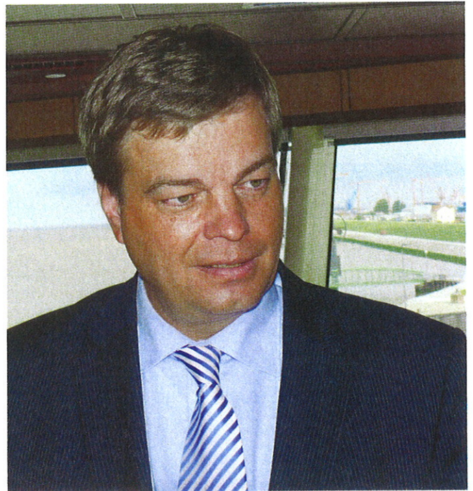
Enak Ferlemann MdB, Parlamentarischer Staatssekretär beim Bundesminister für Verkehr, Bau und Stadtentwicklung

Exzellente: Wie wird sich die Position der Wasserstraßen, im Vergleich zu den beiden anderen Verkehrsträgern Straße und Schiene, entwickeln?